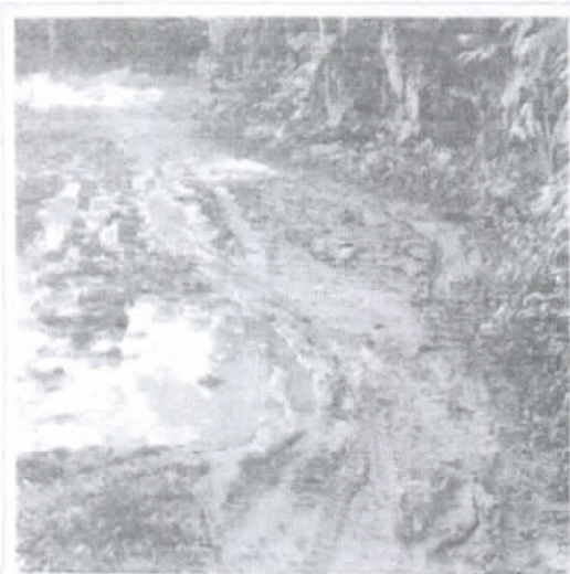
Trecho na Comunidade de Agua Vermelha.