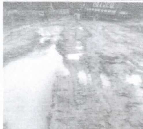
Trecho crítico no setor 15.

Defesa Civil Monte Alegre- Fone (93)99217-8727