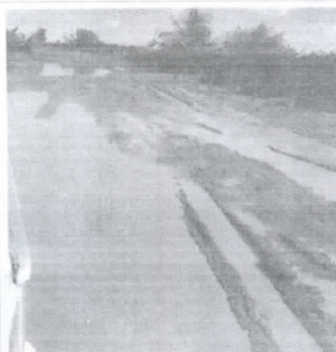
Entra do Setor 06, unica via de acesso pra Serra azul.