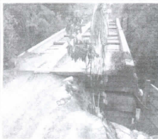
Ponte do setor 02