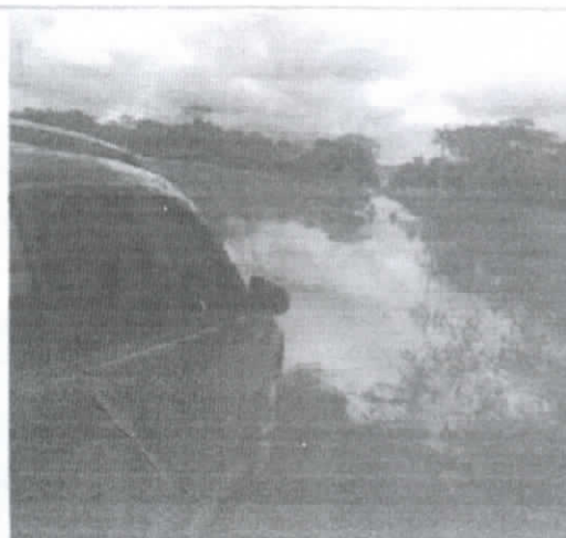
Sector 13 a água subiu mais de um metro em cima da vicinal.