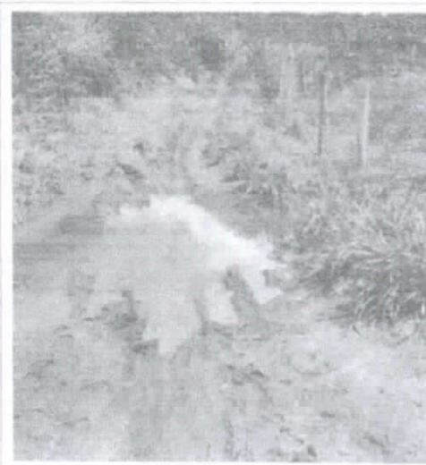
Trecho na comunidade de Ramal do Peola.