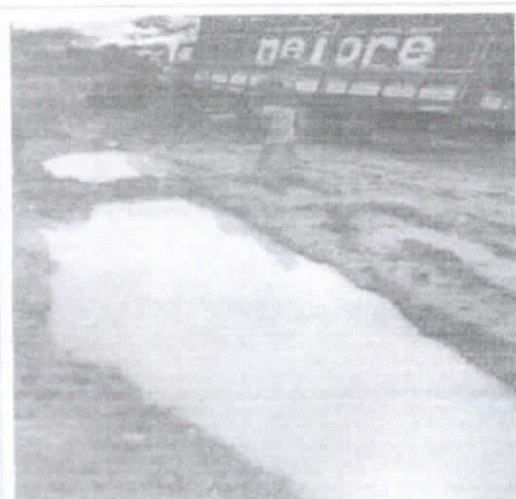
Atoleiro grande no Setor 15 da PA 254.