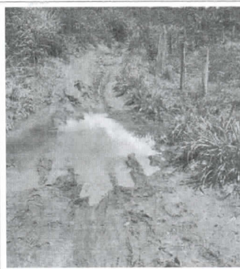
Trecho na comunidade de Ramal do Peola.