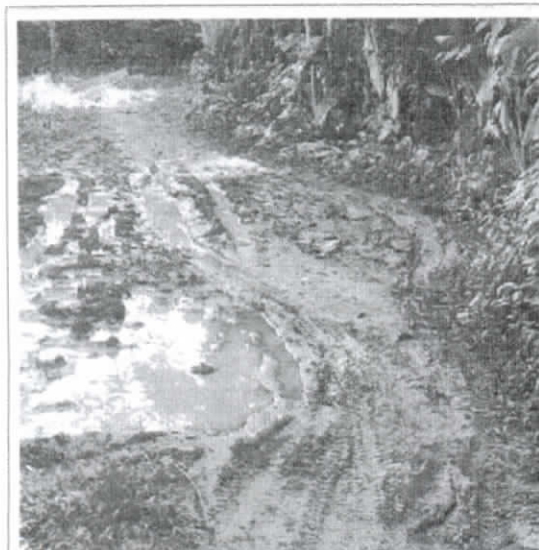
Trecho na Comunidade de Agua Vermelha.