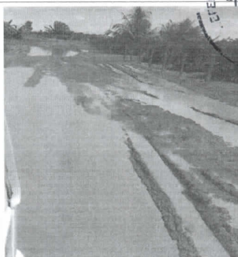
Entra do Setor 06, unica via de acesso pra Serra azul.